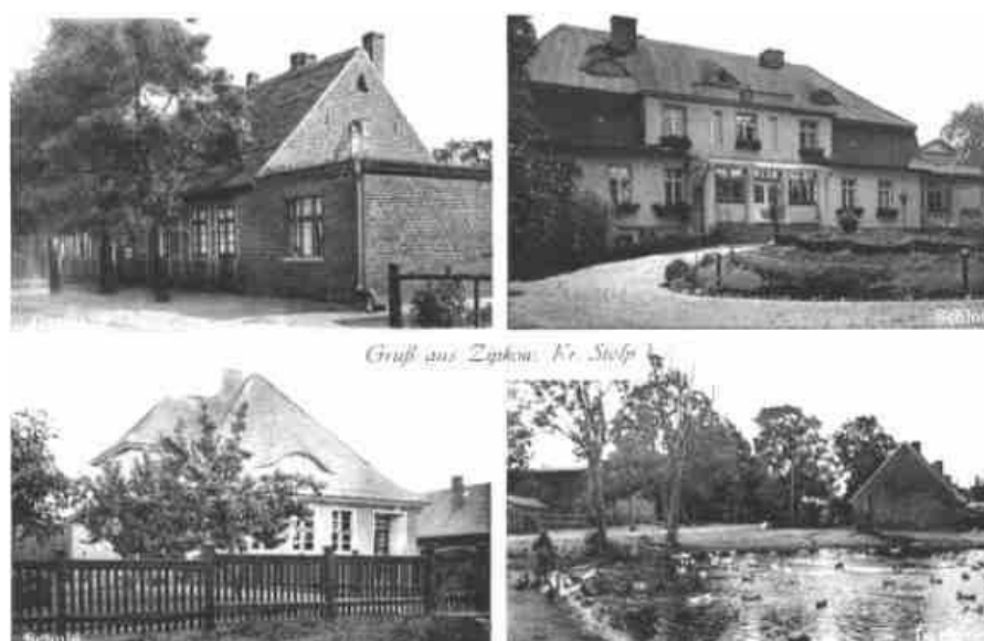
Szczypkowice – 1945 rok