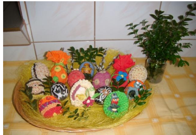
Udział w Gminnym konkursie GOK