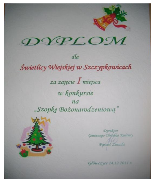
Wybrane osiągnięcia mieszkańców Szczypkowic