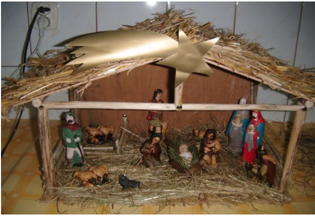
I miejsce w Gminnym konkursie GOK