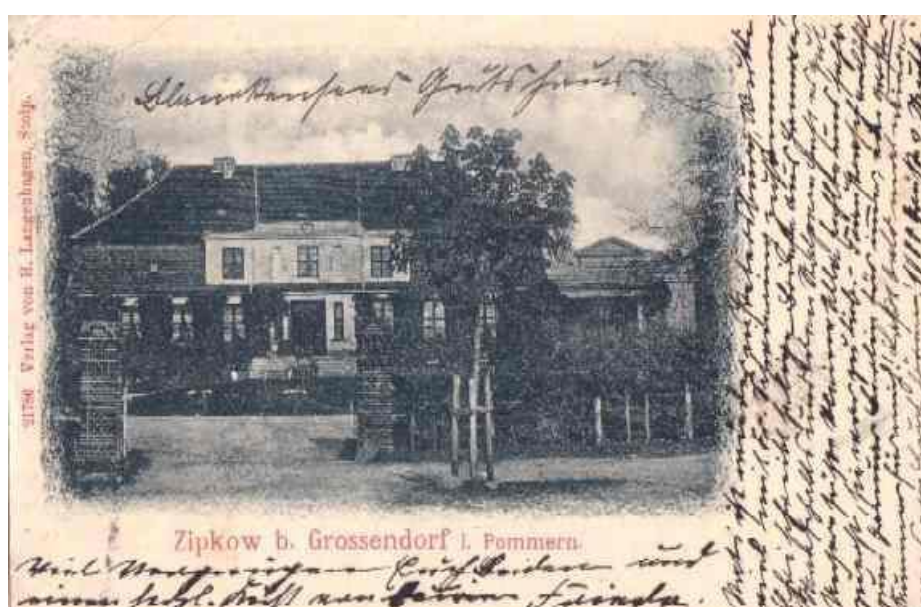
Pałac w Szczypkowicach, pocztówka z 1906 roku