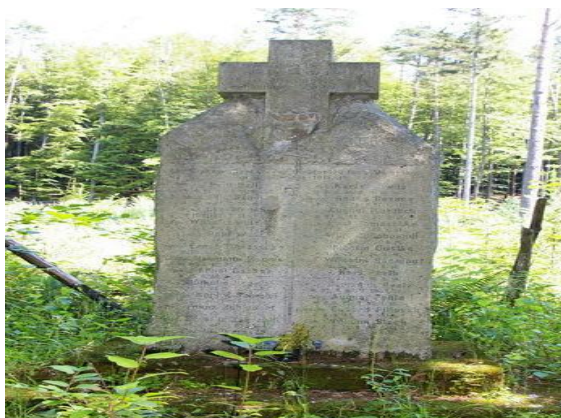
Pomnik poświęcony poległym w I wojnie Światowej.