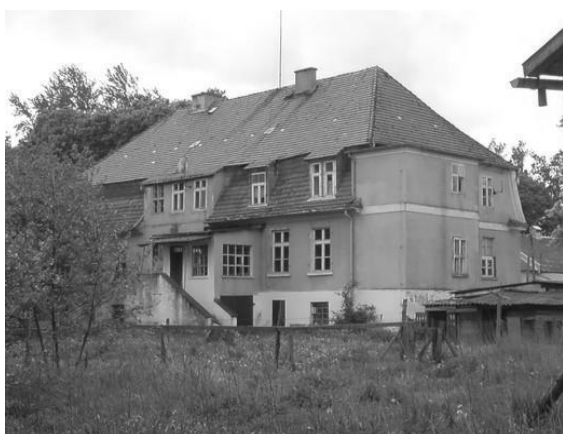
Pałac z XIX wieku.

Istotnym elementem historycznym dla rozwoju wsi była także zabytkowa Gorzelnia Murowana z XIX w. Miejsce pracy dla wielu pokoleń mieszkańców wsi Szczypkowice.