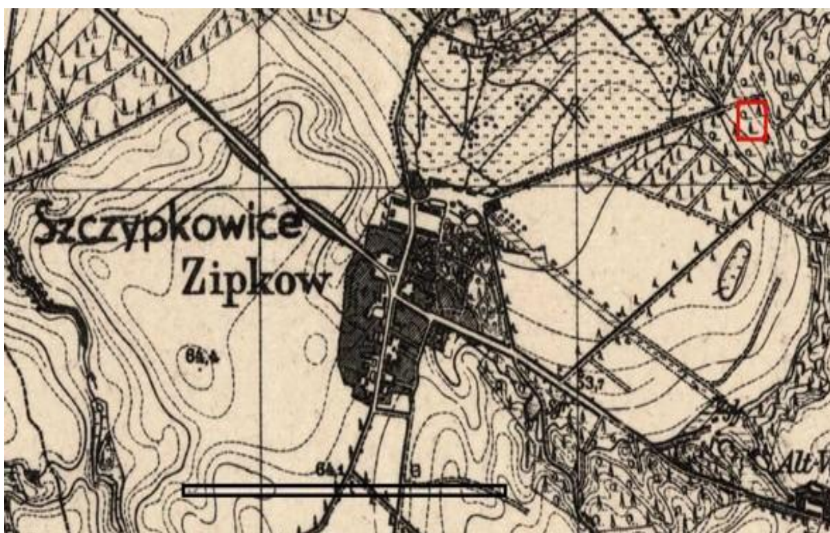
Mapa wsi Szczypkowice przed 1918 rokiem

Plan Odnowy Miejscowości, Szczypkowice 2012 r.