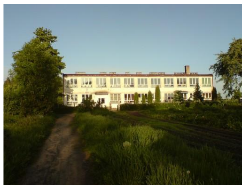
Zespół Szkół Społecznych w Szczypkowicach