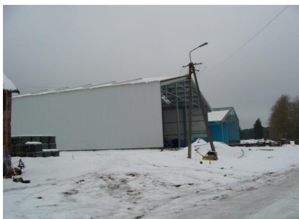
Prace budowlane na terenie dawnego PGR