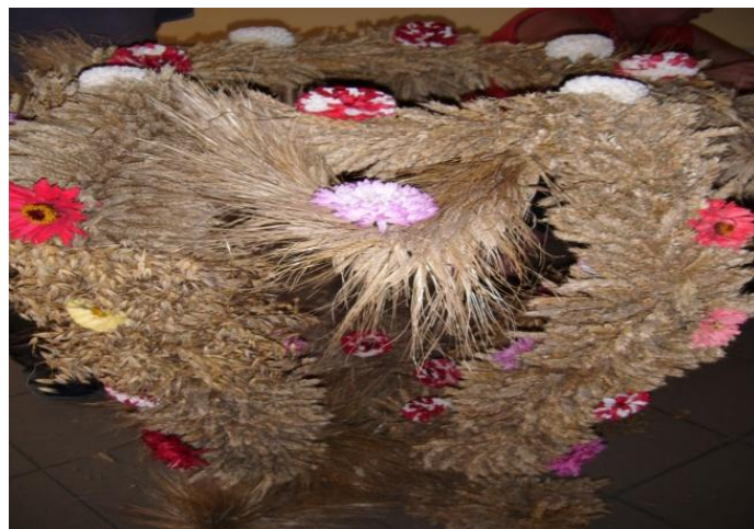
Wieniec dożynkowy – Gminy konkurs