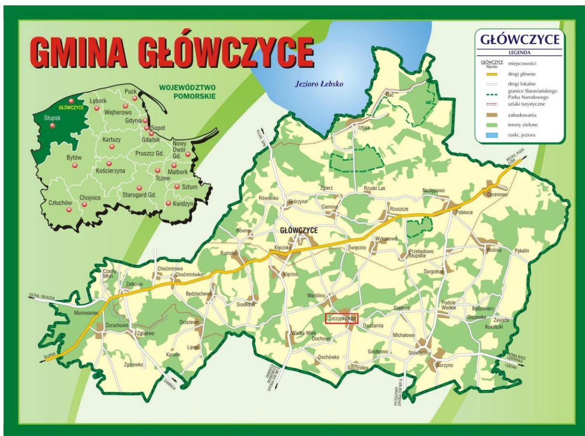
Położenie geograficzno – administracyjne miejscowości Szczypkowice