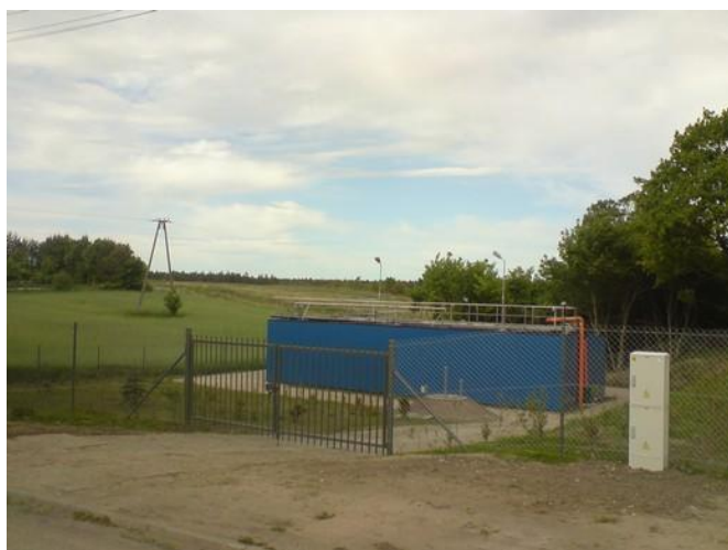
Oczyszczalnia ścieków (2008-2009r.)