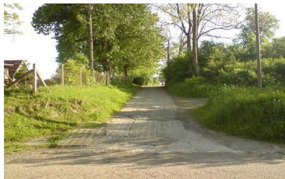
Droga wjazdowa do szkoły