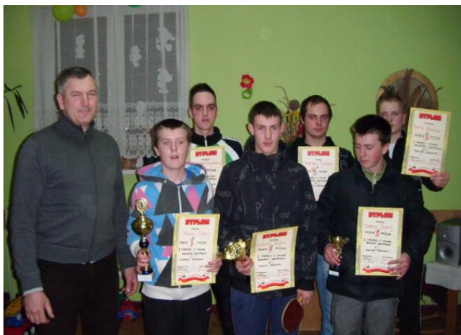
I Turniej o Puchar Radnego Szczypkowic

W Szczypkowicach funkcjonuje także Gminne Towarzystwo Sportowe „Sokół Szczypkowice” założone w 1970 roku. Klub piłki nożnej obecnie znajduje się w klasie B rozgrywek w kategorii seniorzy regionu słupskiego.