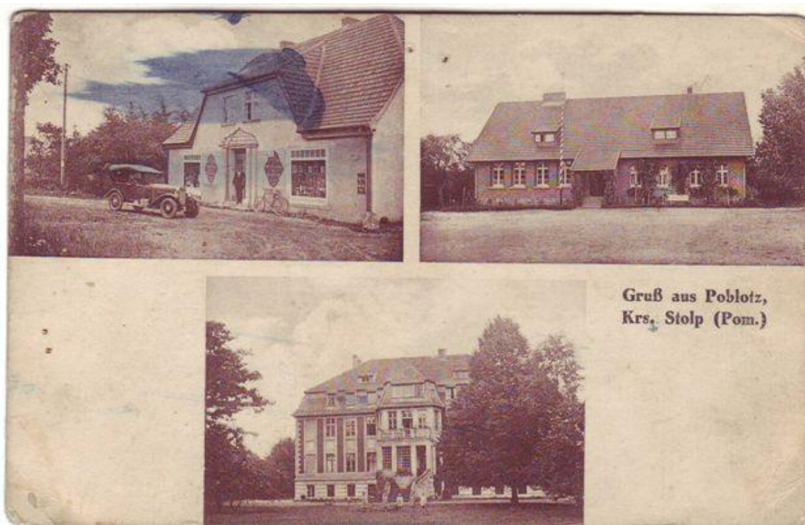
Przedwojenne pocztówki z Poblócia