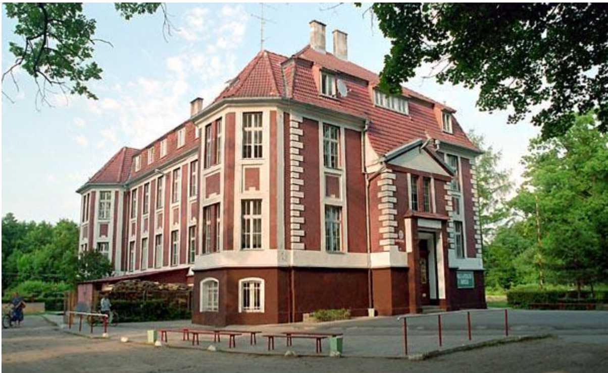
Zespół Szkół w Pobłociu

Plan Odnowy Miejscowości, Pobłocie 2012 r.