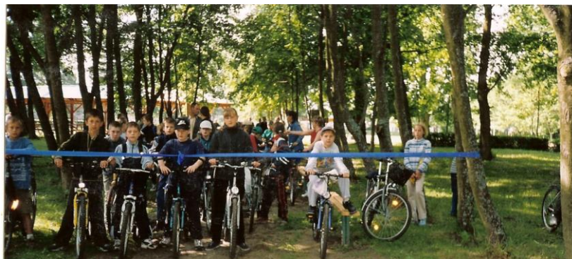
Uroczyste otwarcie trasy rowerowej „Dla odpoczynku i zdrowia”