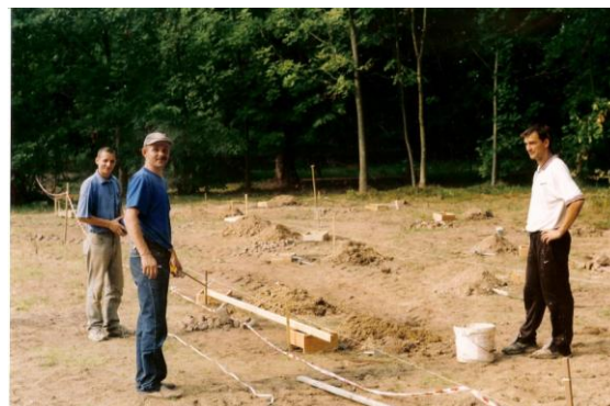
Mieszkańcy Poblócia pracujący przy modernizacji boiska sportowego