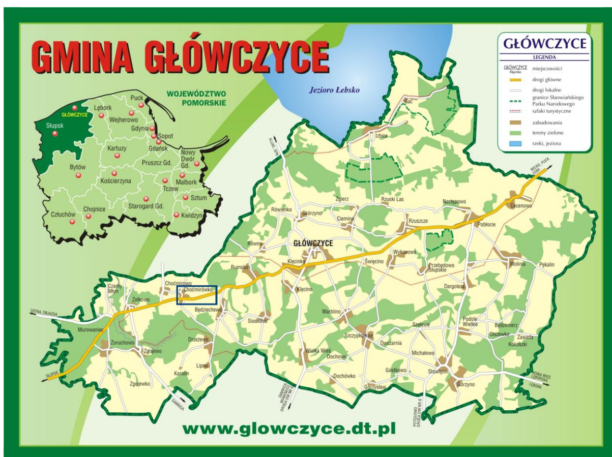
Położenie Choćmirówka na tle Gminy Głównicyce

Pod względem fizycznogeograficznym Choćmirówko mieści się w obrębie Wybrzeża Słowińskiego.