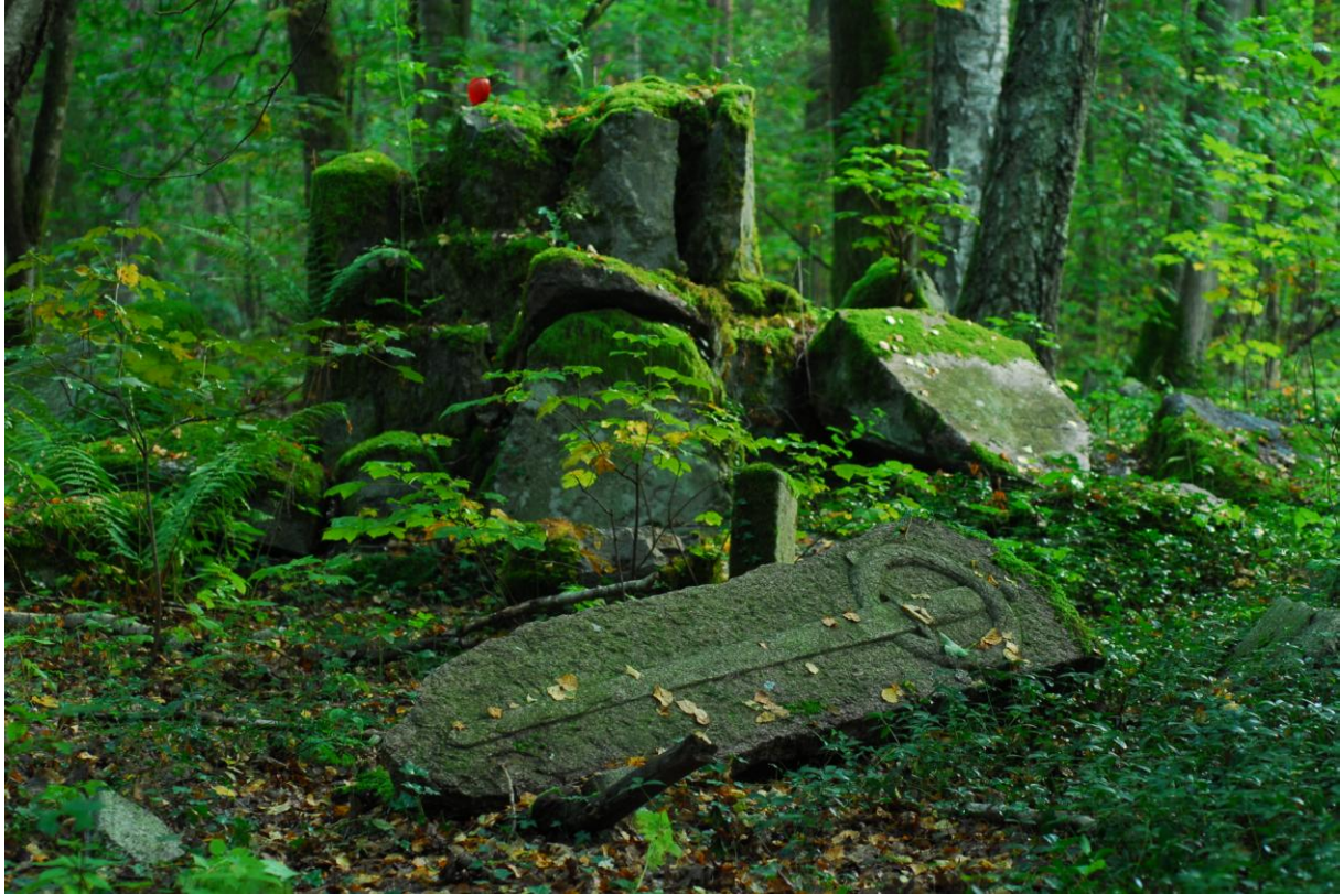
Ruiny pomnika ofiar I wojny światowej