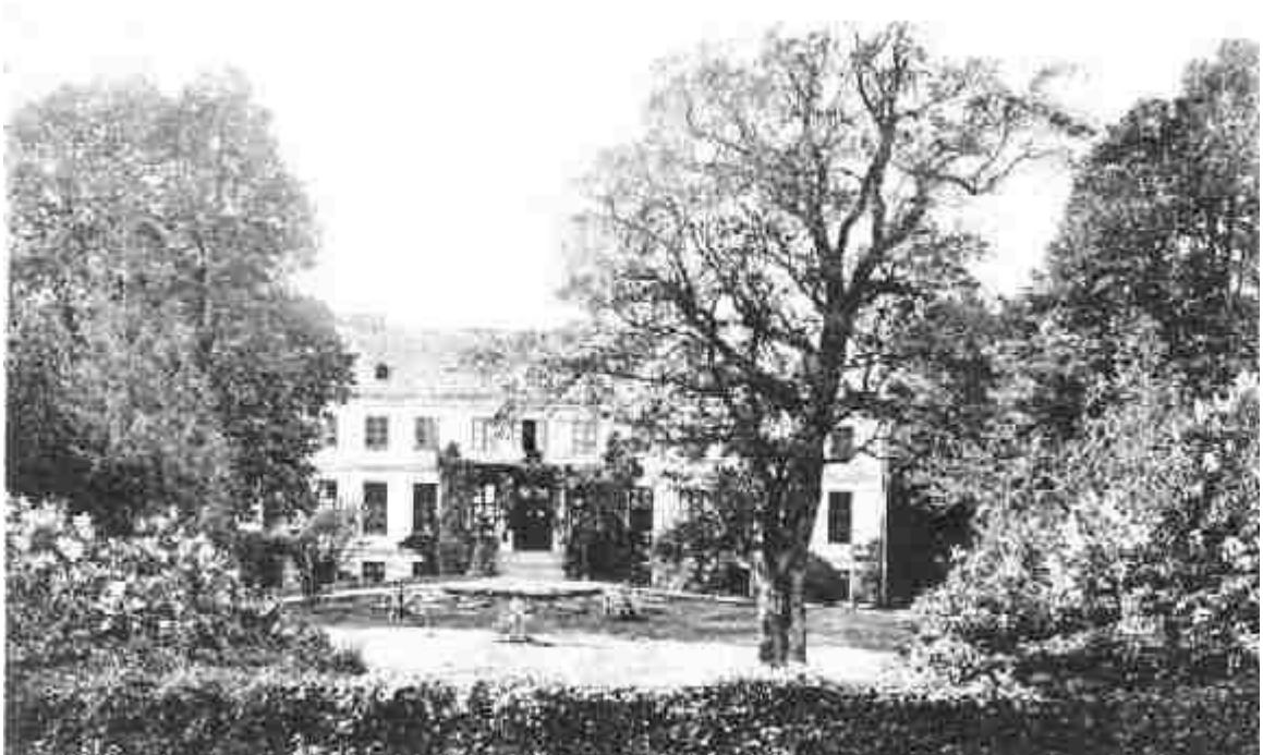
Pałac na pocztówce z 1901 roku.