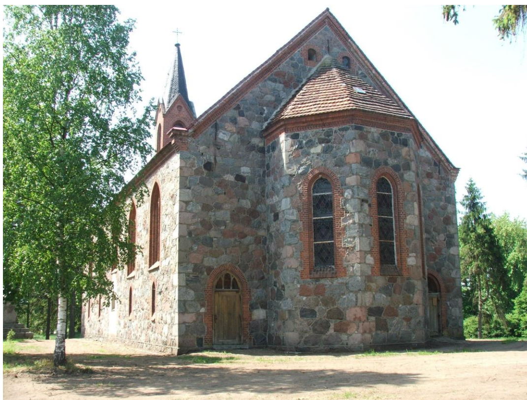
Żelkowo, 2012 rok