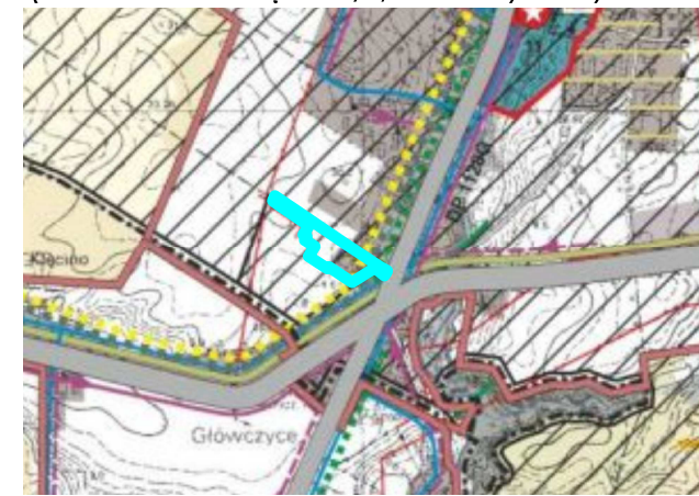
granica terenu opracowania MPZP